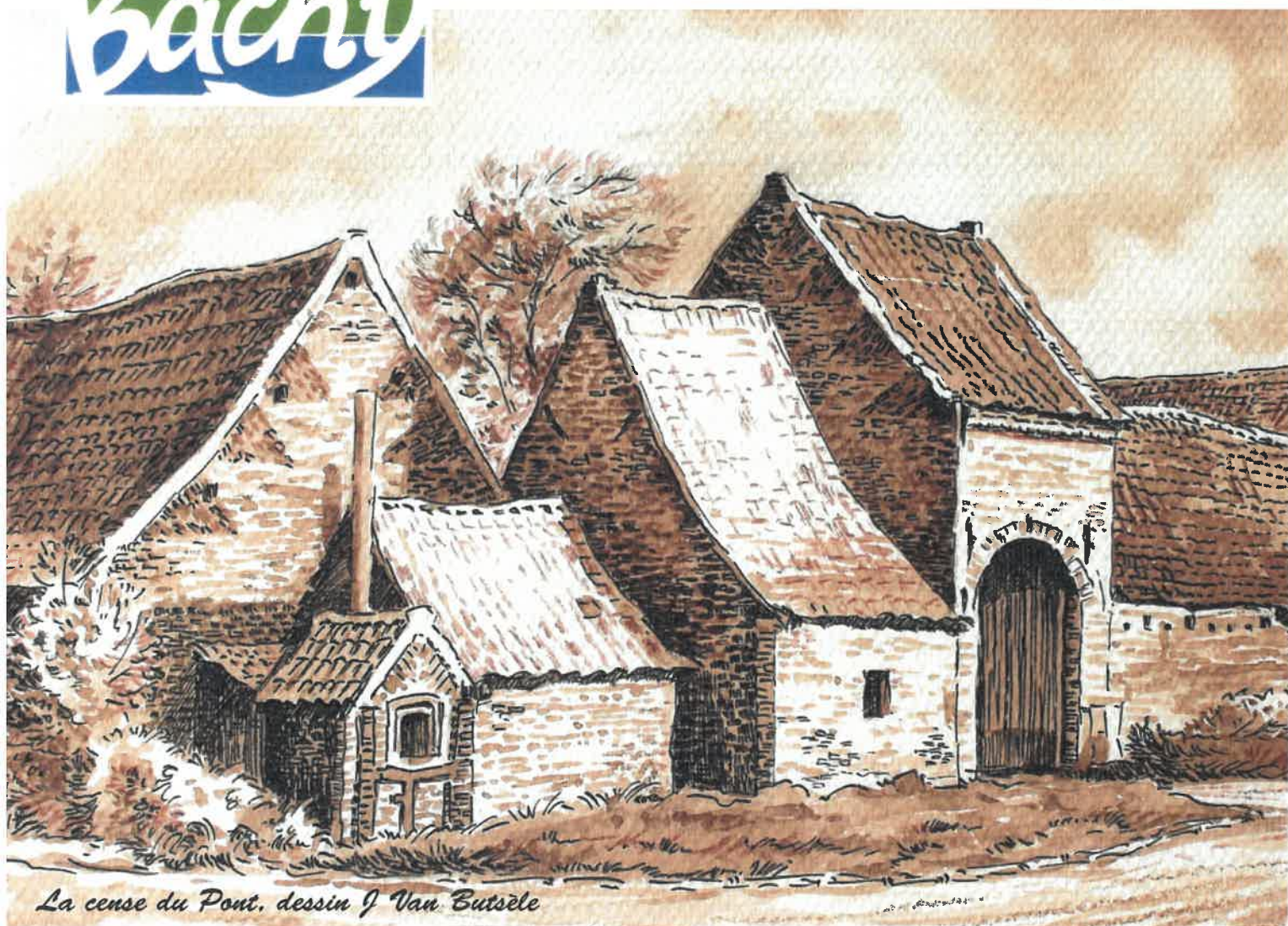
La cense du Pont, dessin J Van Butsèle