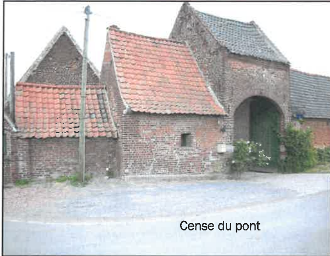
Cense du pont

En 1903 : 0,56 ha blé, 0,18 ha avoine, 0,35 ha pommes de terre, 0,18 ha betteraves fourragères, 0,26 ha pâturages